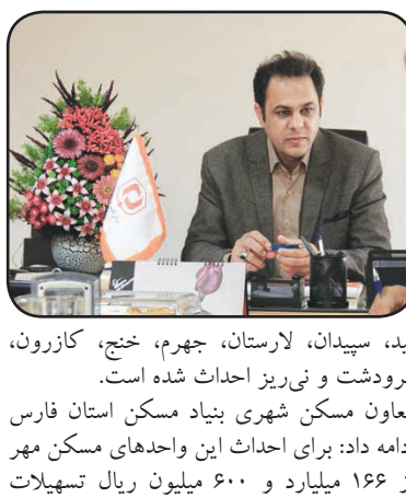
بهره‌برداری از ۷۳۳ واحد مسکن مهر در فارس