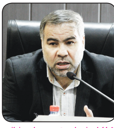
تحلیل این خبر را در ستون سمت راست بخوانید

فرماندار شیراز گفت: مهمترین دغدغه مسئولان و مدیران خدمت و رضایت‌مندی مردم است. به گزارش خبرنگار مهر، حیدر عالی‌شوندی در مراسم تجلیل از کارمندان نمونه شهرستان شیراز گفت: ایران اسلامی امروز یکی از امن‌ترین کشورها در منطقه و جهان است که این امنیت مدیون خون شهدای دوران دفاع مقدس و شهدای مدافع حرم و رزمندگان مدافع حرم است. وی ادامه داد: اعتقاد داریم همه افراد دغدغه خدمت دارند و شرایط کشور نیز خاص است که در این راستا ارتقای رضایت‌مندی مردم