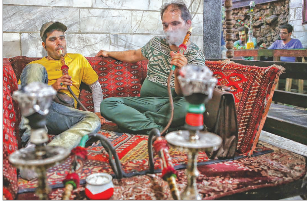
هدر دادن اوقات طلایی همراه با پذیرش سرطان و سیاهی