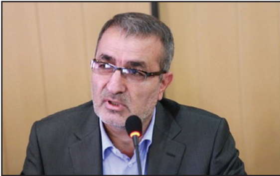
معاون هماهنگی امور اقتصادی فارس گفت: توسعه منابع استناداری فارس افزود: در بحث حضور هیات‌های تجاری خارجی نیز با توجه به شرایط پیش آمده پس از برنامه جامع اقدام مشترک (برجام) سال ۹۵ شاهد حضور حدود ۶۰ هیئت اقتصادی و تجاری خارجی در این استان بودیم.

شده در چهارماه نخست سال ۹۶ نیز بیانگر رشد ۲۹ درصدی نسبت به مدت مشابه سال ۹۵ است. معاون هماهنگی امور اقتصادی فارس افزود: توسعه منابع استناداری فارس افزود: در بحث حضور هیات‌های تجاری خارجی نیز با توجه به شرایط پیش آمده پس از برنامه جامع اقدام مشترک (برجام) سال ۹۵ شاهد حضور حدود ۶۰ هیئت اقتصادی و تجاری خارجی در این استان بودیم.