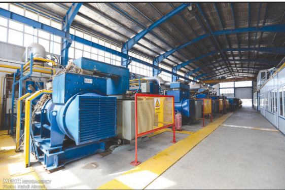
وی ادامه داد: بعد از اصلاحی که پروانه‌ها باطل شد و آمارها شفاف در سال قبل انجام شد و بسیاری از شد. معاون وزیر صنعت، معدن و تجارت:

یزدانی افزود: ۲۹۷ طرح صنعتی با پیشرفت بالای ۵۰ درصد وجود دارد که اشتغالی حدود ۹ هزار نفر به همراه خواهد داشت. وی ادامه داد: در کل کشور ۱۳ هزار طرح صنعتی با پیشرفت بالای ۵۰ درصد وجود دارد که اشتغال بیش از ۴۴۴ هزار نفری به همراه خواهد داشت.