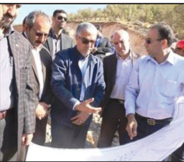
استاندار فارس گفت: اگر چه بنا به اظهار مسئولان ذی‌ربط، بیش از ۶۰ درصد از حوادث جاده‌ای به دلیل خطای انسانی رخ می‌دهد و این استان به استناد آمارهای موجود بیشترین تلفات جاده‌ای کشور را دارد، اما باید بپذیریم که در حوزه حمل‌ونقل جاده‌ای با وضعیت مطلوب به ویژه در زمینه آزادراه و بزرگراه فاصله زیادی داریم.

کار خواهیم گرفت تا به وضعیت مطلوب نسبی در این حوزه دست یابیم. استاندار فارس بیان کرد: ساخت بزرگراه دشت ارژن-قائمیه یکی از طرح‌های بسیار مهم استان فارس به شمار می‌آید و با توجه به توانمندی پیمانکار و مشاور این طرح، امیدواریم این پروژه تا شهریورماه سال ۹۷ به بهره‌برداری برسد.