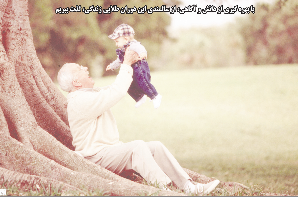
پایبندگی و دلگیری از دلگشا و آنگلی از اسامندی این دوران طلایی زندگی، لذت ببریم