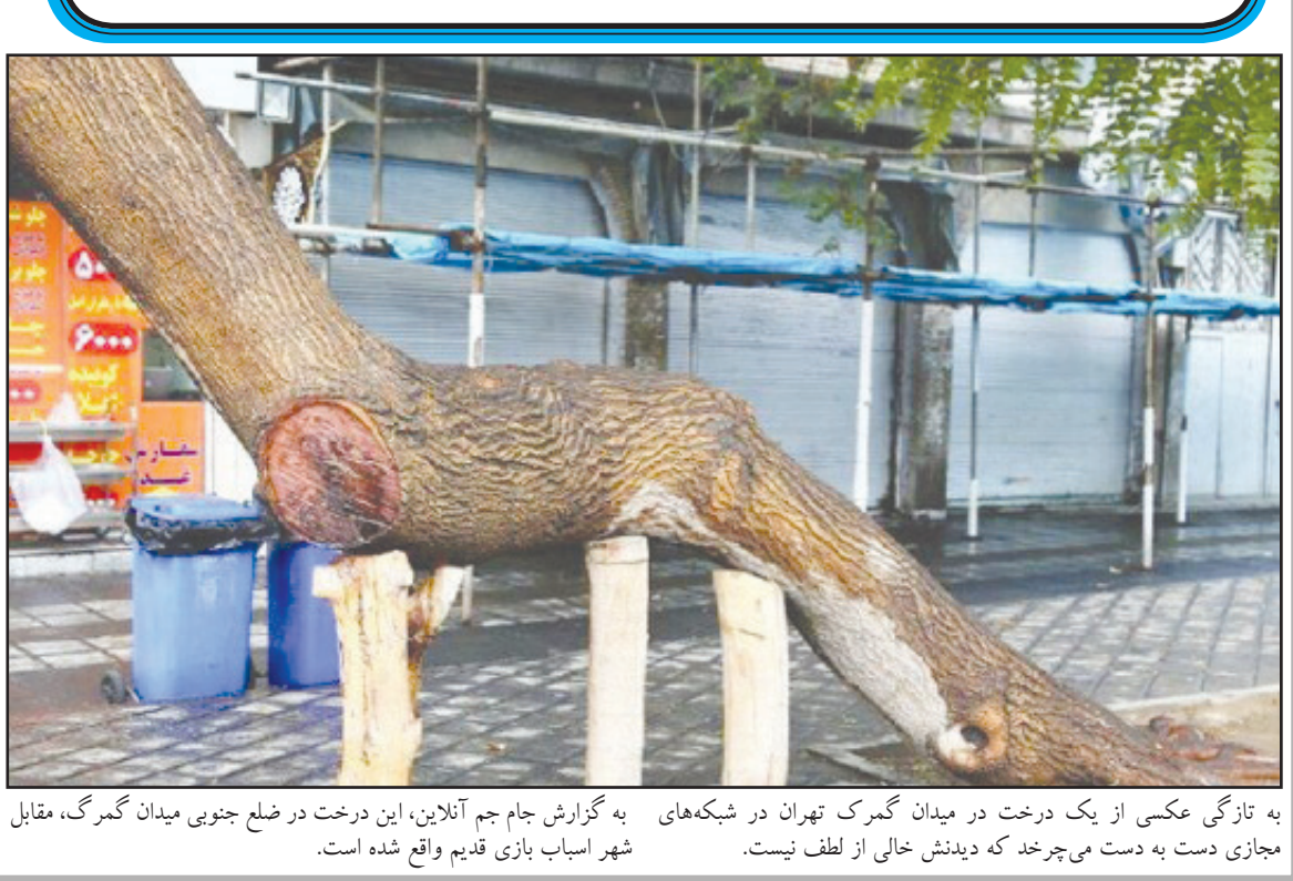
به تازگی عکسی از یک درخت در میدان گمرک تهران در شبکه‌های مجازی دست به دست می‌چرخد که دیدنش خالی از لطف نیست. به گزارش جام جم آنلاین، این درخت در ضلع جنوبی میدان گمرک، مقابل شهر اسباب بازی قدیم واقع شده است.