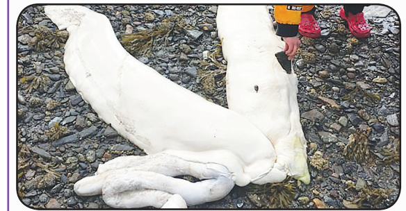
پیدا شدن بقایای یک موجود به ظاهر دریایی همه را متعجب کرده است. برخی از حدس و گمان‌ها حاکی از این است که ممکن است این موجود کوسه باشد اما هنوز اطمینانی در این باره وجود ندارد.