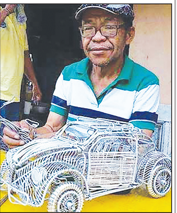
یک هنرمند خوش‌ذوق فیلیپینی با استفاده از سیم‌های مسی موتورسیکلت خودروهایی تزئینی زیبایی را طراحی کرده است.