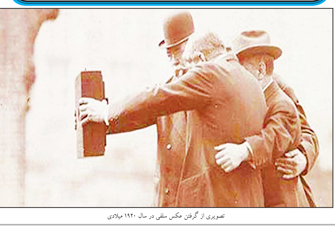
تصویری از گرفتن عکس سلفی در سال ۱۹۲۰ میلادی