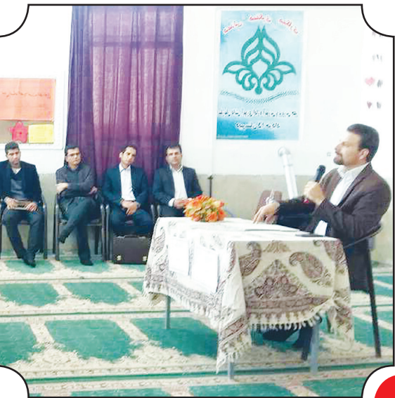
سخنرانی عباس خادم الحسینی در شهرستان خفر