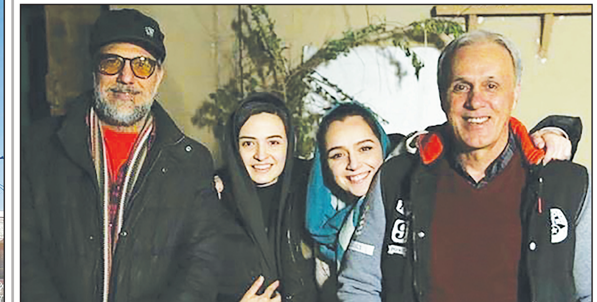
حمید علیدوستی پیشکسوت و ستاره سابق فوتبال ایران که پدر ترانه علیدوستی، بازیگر سریال شهرزاد، در پشت‌صحنه این سریال حاضر شد. بی‌ظنیر و مهربان هستند، کار کردن کنار گروه همدل شهرزاد... به گزارش جام جم آنلاین، گلاره عباسی بازیگر نقش «اکرم» در