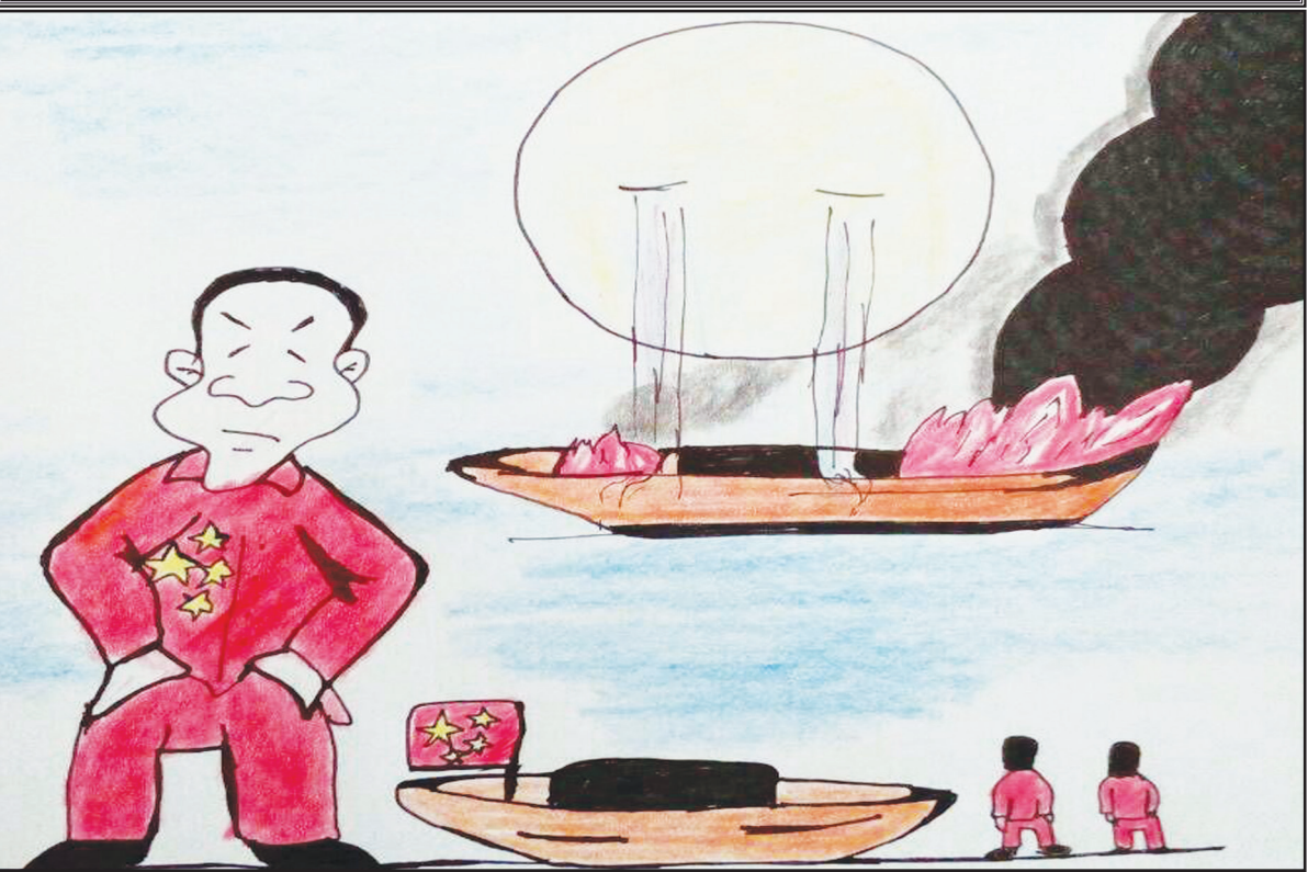
کارکاتور است: امین شش‌بلوکی