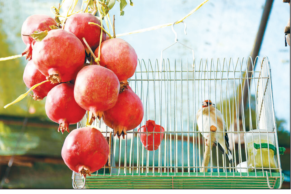
چه خوش است حال مرغی که قفس ندیده باشد / چه نکوتر آنکه مرغی ز قفس پریده باشد