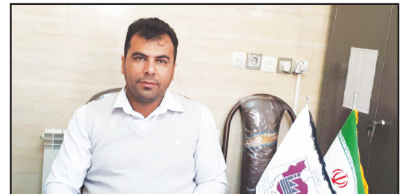
خبرنگار و عکاس / ایمان احمدی: مسئول شهرک‌های صنعتی کازرون گفت: جهت تکمیل و توسعه امکانات زیربنایی در منطقه ویژه اقتصادی کازرون اعتباری بالغ بر ۶۴ میلیارد ریال هزینه شده است.

مسئول شهرک‌های صنعتی کازرون خبر داد توسعه امکانات زیربنایی در منطقه ویژه اقتصادی کازرون