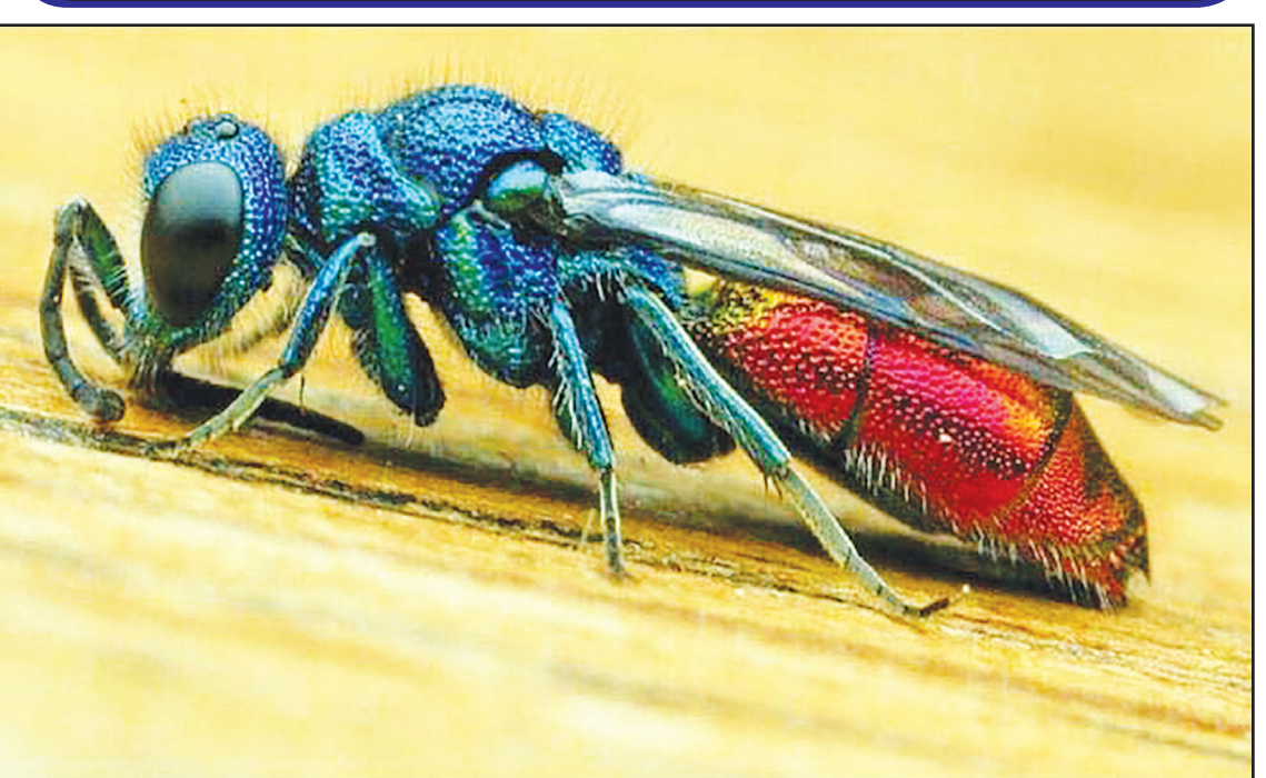
زنبور دم یاقوتی رنگین ترین و زیباترین زنبور جهان است. حتی پاهای این حشره هم رنگ های رنگین کمانی دارند و در برابر نور خورشید می درخشند و زیبایی شگفت انگیز به آن داده اند.