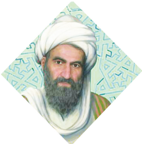
ولایت آب خورده.