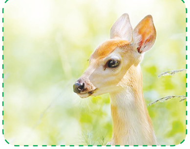
مدیرکل حفاظت محیط‌زیست فارس گفت: با فرارسیدن فصل زایش وحوش در فصل زایمان و برای زادآوری حیات‌وحش، کنترل‌های امن برای زادوولد حیوانات، ورود گارد محیط‌زیست صورت می‌گیرد تا فضای آرام و مطلوبی فراهم شود. لذا از ورود افراد به مناطق حساس پارک ملی بوم در جوار شهر شیراز جلوگیری می‌شود. مدیرکل حفاظت محیط‌زیست استان فارس ادامه داد: با توجه به ممنوعیت بازدید تا انتهای فصل زایمان مجوز بازدید از مناطق شیری چان خود را از دست می‌دهد و نوزاد متولدشده نیز به دلیل عدم تغذیه اشیر مادر دچار سوءتغذیه می‌شود و رشد مناسبی نخواهد داشت. مدیرکل حفاظت محیط‌زیست فارس افزود: به همین علت به حفاظت از مناطق حساس اقدام به حفاظت از مناطق می‌کند و در طول این مدت گروه‌های سیر این یگان و پاسگاه‌های محیط‌زیستی فعال‌تر و هوشیارتر از همیشه مناطق تحت حفاظت را حراست و کنترل خواهند کرد و از سودجویی و اقدامات خلاف قانون شکارچیان غیرمجاز به‌شدت جلوگیری خواهد شد. وی با اظهار تأسف از ناآگاهی برخی افراد سودجو و شکارچیان در جداسازی نوزاد حیوانات از مادر

اهمیت قوچ و میش، کل و بز و آهوان و برخی از گوشت‌خواران و پرندگان در پارک ملی بوم، گوزن زرد در میانکل ارژن و جیبر در نیریز و سایر حیوانات در مناطق حفاظت‌شده استان فارس اعلام شد. مدیرکل حفاظت محیط زیست فارس گفت: با فرارسیدن فصل زایش وحوش در فصل زایمان و برای زادآوری حیات‌وحش، کنترل‌های امن برای زادوولد حیوانات، ورود گارد محیط‌زیست صورت می‌گیرد تا فضای آرام و مطلوبی فراهم شود. لذا از ورود افراد به مناطق حساس پارک ملی بوم در جوار شهر شیراز جلوگیری می‌شود. مدیرکل حفاظت محیط‌زیست استان فارس ادامه داد: با توجه به ممنوعیت بازدید تا انتهای فصل زایمان مجوز بازدید از مناطق شیری چان خود را از دست می‌دهد و نوزاد متولدشده نیز به دلیل عدم تغذیه اشیر مادر دچار سوءتغذیه می‌شود و رشد مناسبی نخواهد داشت. مدیرکل حفاظت محیط‌زیست فارس افزود: به همین علت به حفاظت از مناطق حساس اقدام به حفاظت از مناطق می‌کند و در طول این مدت گروه‌های سیر این یگان و پاسگاه‌های محیط‌زیستی فعال‌تر و هوشیارتر از همیشه مناطق تحت حفاظت را حراست و کنترل خواهند کرد و از سودجویی و اقدامات خلاف قانون شکارچیان غیرمجاز به‌شدت جلوگیری خواهد شد. وی با اظهار تأسف از ناآگاهی برخی افراد سودجو و شکارچیان در جداسازی نوزاد حیوانات از مادر