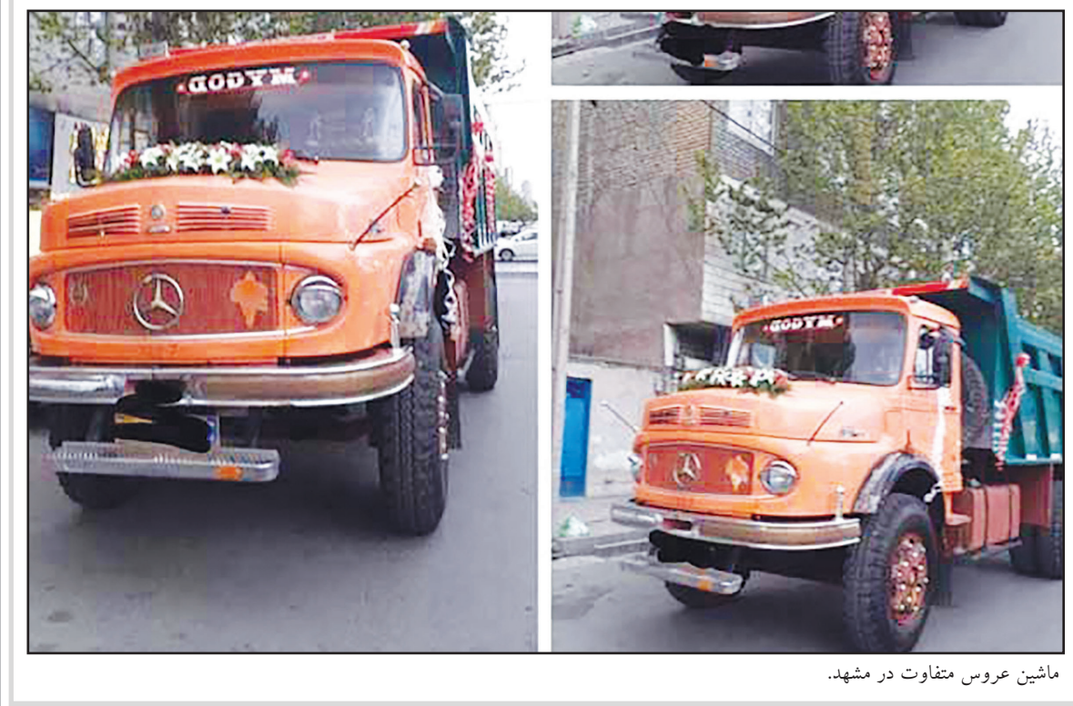
ماشین عروس متفاوت در مشهد.