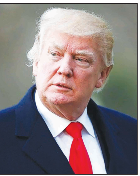
یک زن روستایی در اسپانیا به دلیل شباهت زیادش به رئیس جمهور آمریکا، در رسانه ها و شبکه های اجتماعی به بدل ترامپ معروف شده است.