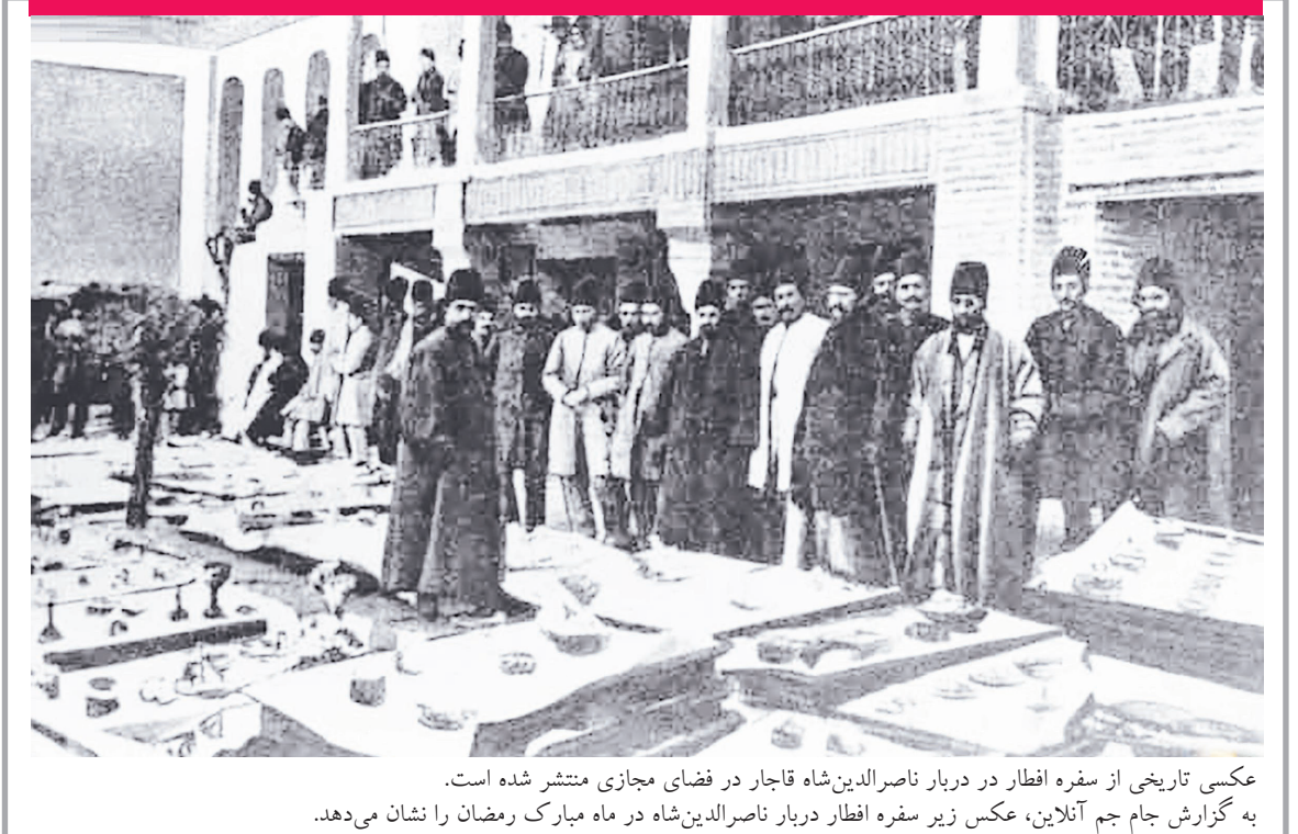
عکسی تاریخی از سفره افطار در دربار ناصرالدین‌شاه قاجار در فضای مجازی منتشر شده است. به گزارش جام جم آنلاین، عکس زیر سفره افطار دربار ناصرالدین‌شاه در ماه مبارک رمضان را نشان می‌دهد.