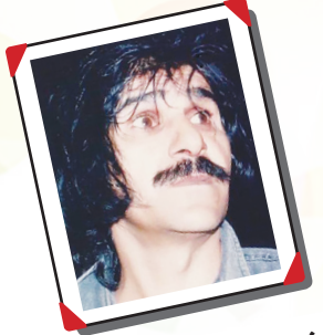
زندهیاد حسین پنهانی

عطر تو تراود مگر از بستر امشب کائن گونه گریزان شده خواب از سرم امشب چون تشنه پس از وصیت دریا و چه کوتاه از هر شب دیگر تکتوتنتهاترم امشب بیدار نشستم که غمت را چو چراغی از شب بستانم، به سحر بسپرم امشب این گونه مضاعف شده ظلمت که من ای دوست از دولت یاد تو شبی دیگر امشب ای کاش پری وار فرود آیی از آفاق یا آن که دهد سحر تو بالو پیرم امشب تا پیشتر از آن که شوم سنگ در این شب رخت خود از این مهلکه بیرون برم امشب اشکت چه شد ای چشم! که آن برق شهابی شعری شده آتش زده در دفتر امشب