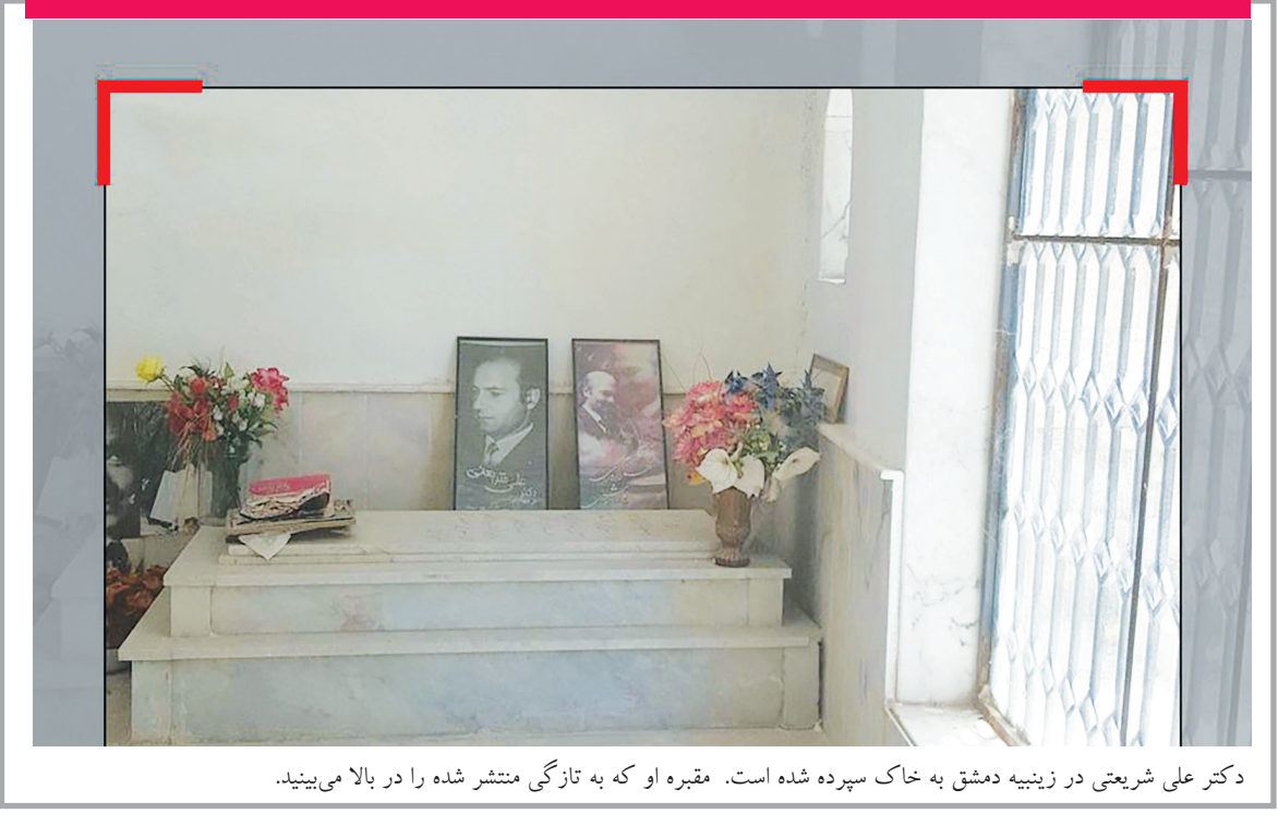
دکتر علی شریعتی در زینبیه دمشق به خاک سپرده شده است. مقبره او که به تازگی منتشر شده را در بالا می بینید.