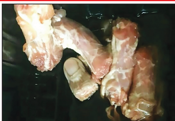
زن خانه داری که پس از خرید یک بسته مرغ قصد تهیه غذا داشت با صحنه ای وحشتناک روبه رو شد.

به گزارش جام جم آنلاین به نقل از باشگاه خبرنگاران، زن جوان اهل پلاروس که قصد تهیه غذا با یک بسته مرغ خریداری شده را داشت با صحنه ای وحشتناک روبه رو شد. این زن یک انگشت بریده شده انسان را در داخل این بسته مرغ پیدا کرد. زن جوان که هویتش مشخص نشده است بلافاصله با پلیس تماس گرفت و ماجرا را به پلیس اطلاع داد. پس از تحقیقات پلیس مشخص شد این انگشت متعلق به یکی از کارگران یک کارخانه بسته بندی مرغ بوده که هنگام تمیز کردن مرغ ها بریده شده و اشتباهاً داخل یکی از بسته ها قرار داده شده بود. بنا به گزارش پلیس محلی پلاروس این کارگر تاکنون چندین انگشت دست خود را حین کار از دست داده است. انشماره این خبر با واکنش طنز برخی کاربران نیز همراه بود. یکی از کاربران در کامنتی نوشت: «احتمالاً بسته های مرغی که در داخل آن انگشتان بریده شده دیگر این کارگر قرار داده شده بود توسط مشتریان خریداری شده و آنها مانند این زن آن قدر خوش شانس نبودند که انگشتان را پیدا کنند.» گفتنی است: این کارخانه بسته بندی مرغ در منطقه «هنسنگ» در مرکز پلاروس قرار دارد و تحقیقات پلیس در این خصوص ادامه دارد.