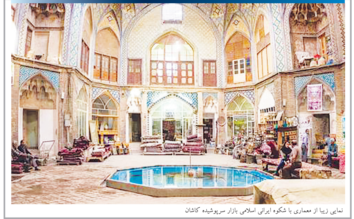
نمایی زیبا از معماری با شکوه ایرانی اسلامی بازار سرپوشیده کاشان