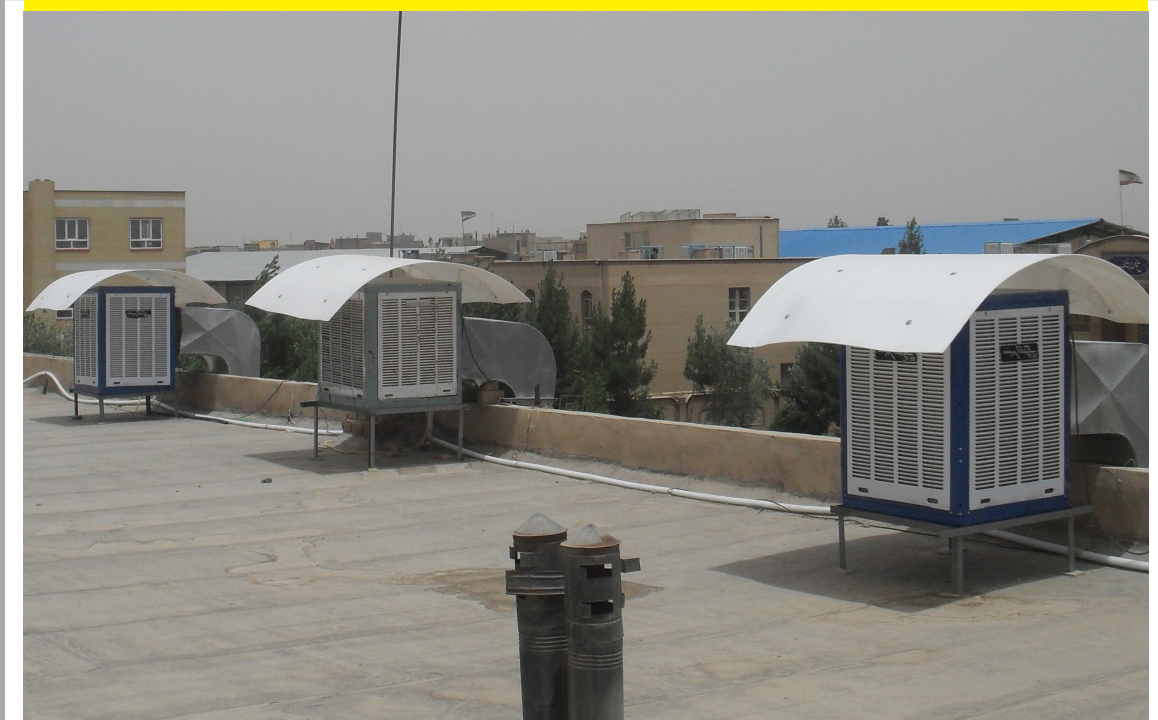
نصب سایه بان بر روی کولرها، در مصرف آب و برق صرفه جویی کنیم