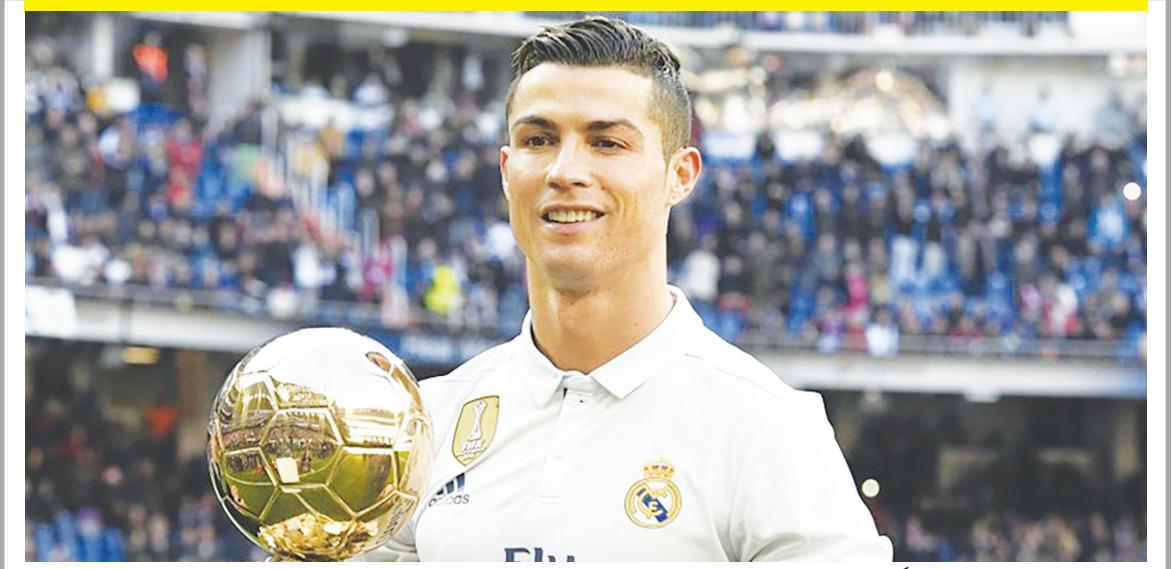
کریستیانو رونالدو یکی از بزرگترین و تاریخی ترین نقل و انتقالات تاریخ فوتبال را به نام خودش ثبت کرده است. به گزارش جام جم آنلاین، یوونتوس تا پیش از پیوستن رونالدو به این تیم بسیار تیم محبوبی در سراسر جهان بود؛ اما حالا که کریس آمده این محبوبیت بیشتر هم شده است. او هنوز نماینده رکوردهای متعددی در رابطه با یوونتوس جابجا کرده است. پست فورترتا یوونتوس کریس رونالدو ۱۱ میلیون و ۵۸۶ هزار لایک، رکورد لایک های یک پست اینستاگرامی متعلق به یک ورزشکار را شکست.