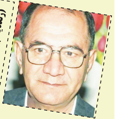
گل نازدارم مه شوگارم

بیو بیو که دلم سیت تنگه ندونم تا کی دلت چی سنگه