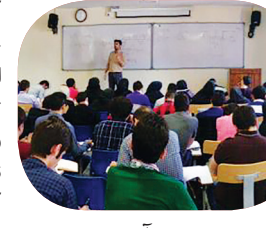
مشاور وزیر آموزش و پرورش در شیراز: سخت‌گیری برای قبولی در کنکور دانش آموز را سرخورده می‌کند