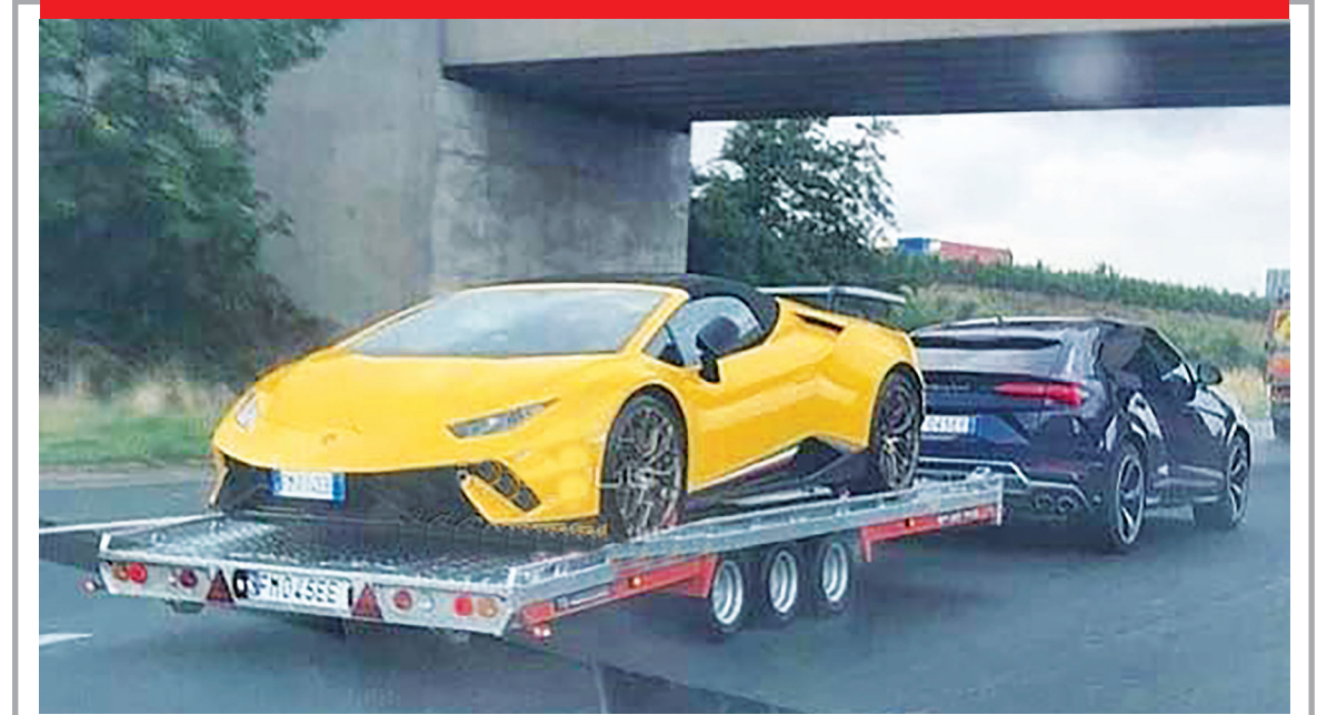
از مشرق، تصویر بالا جابه جایی یک دستگاه خودروی لامبورگینی هوراکان توسط لامبورگینی شاسی بلند «اوروس» نشان می دهد.

جاهه جایی خودروی لامبورگینی هوراکان توسط یک دستگاه دیگر لامبورگینی را در تصویر مشاهده می کنید. به گزارش جام جم آنلاین