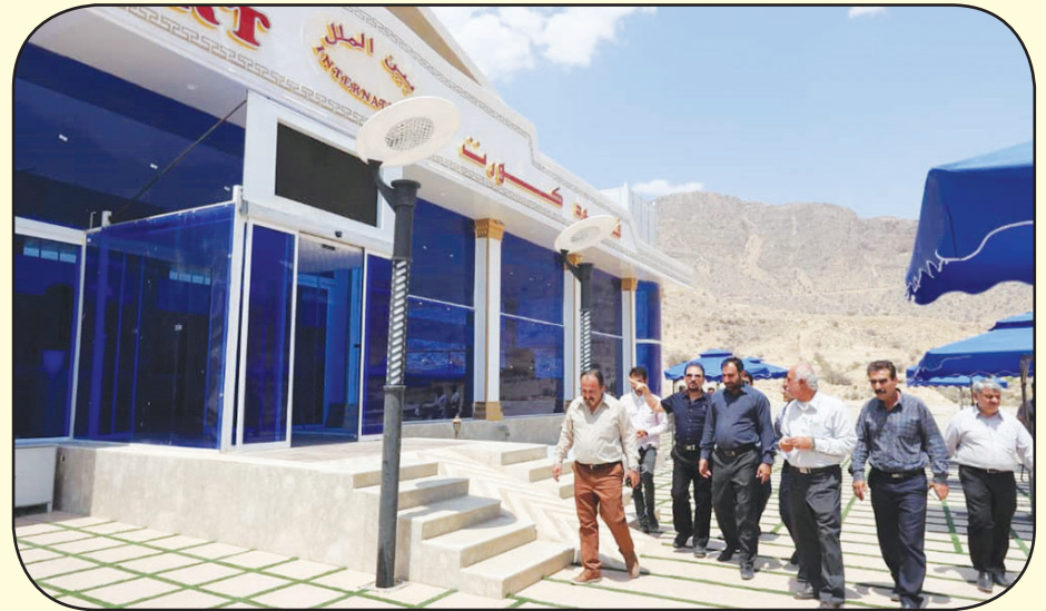
فرماندار کازرون در بازدید از پروژه ستاره پریشان