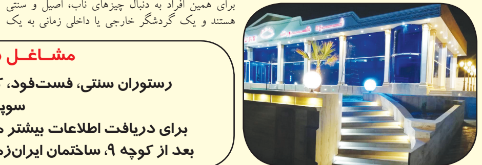
مشاغل زیر جهت رهن و اجاره واگذار می شود:

فرهنگی کازرون ارائه می شود گفت: چشم انداز خوبی برای این پروژه پیش بینی می کنیم و امیدوارم الگوی خوبی نه تنها در فارس بلکه برای کشور شود و برای رسیدن به این مرحله با تمام وجود در کنار عوامل آن خواهیم بود. وی تصریح کرد: کارهای مدرن همه جا دیده می شود، برای همین افراد به دنبال چیزهای ناب، اصیل و سنتی هستند و یک گردشگر خارجی یا داخلی زمانی به یک