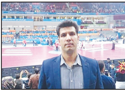
نوجوانان و جوانان بانوان را بر عهده دارند.

۱۲ مهر آغاز می‌شود که با رایزنی‌های صورت گرفته و موافقت فرمانده نیروی زمینی ارتش، تیم کازرون به‌عنوان نایب‌قهرمان دوره گذشته لیگ برتر با نام نیروی زمینی کازرون در این مسابقات شرکت خواهد کرد و در هفته نخست به مصاف میزبان خود نماینده همدشت می‌رود. وی، به حضور بیش از ۳۰ هندبالیست فارسی در رده‌های گوناگون سنی آقایان و بانوان در تیم‌های ملی اشاره کرد و گفت: هم‌اکنون ۳ نفر از مربیان هندبال فارس هدایت تیم‌های ملی نونهالان مردان و