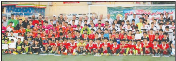
فوتبالیست‌های نونهال استان فارس برای شرکت در رقابت‌های کشوری انتخاب شدند.

این پیشکوت فوتبال فارس ادامه داد: به هنگام برگزاری رقابت‌های کشوری در کرج، مربیان تیم ملی نونهالان نیز حضور دارند و بازیکنان مستعد را انتخاب خواهند کرد. رقابت‌های فوتبال نونهالان کشور، هجدهم شهریورماه جاری در کرج برگزار می‌شود و به مدت سه روز ادامه دارد.