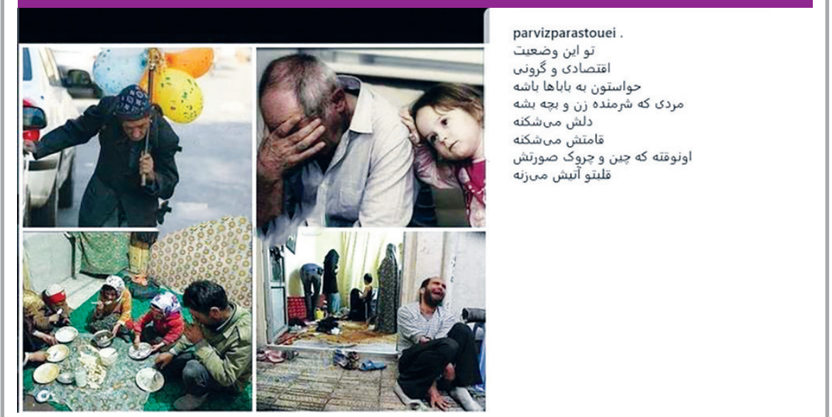
پرویز پرستویی بازیگر معروف سینما و تلویزیون در اینستاگرام خود نوشت: تو این وضعیت اقتصادی و گرونی حواستون به باباها باشه مردی که شرمند زن و بچه باشه دلش می‌شکنه قامتش می‌شکنه اونوقته که جن و چروک صورتش قلیتو آتیش می‌زنه تلویزیون در اینستاگرام خود نوشت: تو این وضعیت اقتصادی و گرونی حواستون به باباها باشه. مردی که شرمند زن و بچه بشه دلش می‌شکنه، قامتش می‌شکنه، اونوقت هست که چین و چروک صورتش قلیتو آتیش می‌زند.