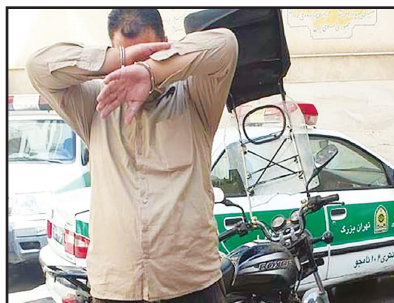
تاکون ۵ شاکی وی را شناسایی کرده‌اند.

وی ادامه داد: سارق در مرحله اول اقدام به فرار می‌کند؛ اما وقتی می‌بیند زن از جای خود بلند نشده است، برمی‌گردد و کیف زن را هم به سرقت می‌برد.