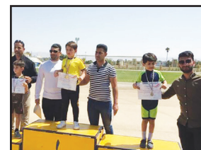
تیم اوز با کسب ۶ مدال در مسابقات

استان فارس خوش درخشید. مسابقات اسکیت سرعت استان فارس به میزبانی شیراز در بخش بانوان و در بخش آقایان برگزار شد که اسکیت‌بازان نونهال و نوجوان زیر نظر هیئت اسکیت اوز توانستند دو مدال طلا، دو نقره و دو برنز را از آن خود نمایند.