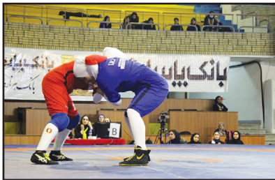
تیم ملی کشتی کلاسیک بانوان کشورمان خود را برای حضور در نخستین رویداد بین‌المللی این رشته که امروز در شهر بیروت، پایتخت کشور لبنان برگزار می‌شود، آماده می‌کند.

همچنین این تیم در نخستین دوره رقابت‌های جهانی این رشته که قرار است اواسط آذرماه ۹۷ برگزار شود، شرکت خواهد کرد. کشتی کلاسیک بانوان با پوشش کامل از سوی فدراسیون کشتی ایران به اتحادیه جهانی پیشنهاد شد که مورد موافقت قرار گرفت. این رشته با توجه به نوع پوشش کامل، گوش‌بند و حفاظ سر، مورد توجه بانوان زیادی در کشورهای مختلف دنیا قرار گرفته است. تکنیک‌های فنی این رشته همانند کشتی آزاد زنان است اما با توجه به پوشش در نظر گرفته شده، این پیکارها در ۲ و ۲ دقیقه‌ای برگزار می‌شود.