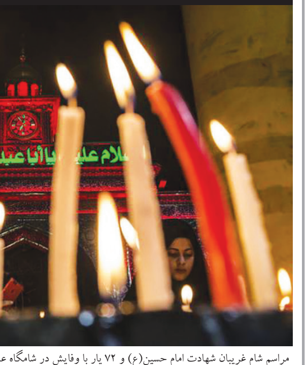
مراسم شام غریبان شهادت امام حسین(ع) و ۷۲ یار با وفایش در شامگاه عاشورا با حضور عاشقان آن حضرت در شهر کربلای معلی برگزار شد.