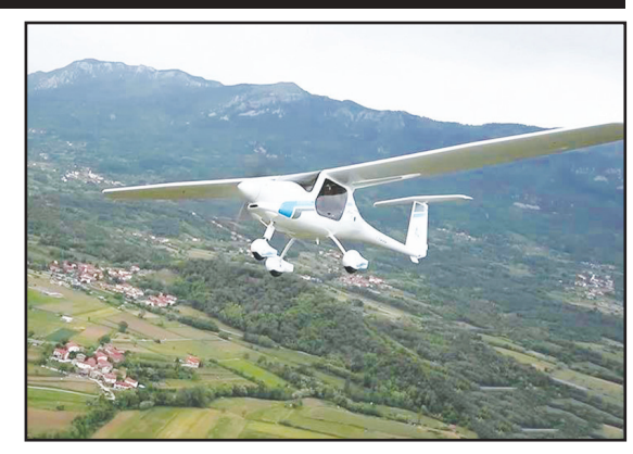
در ماه جولای سال ۲۰۱۸، در یک پرواز با هواپیمای الکتریکی از فرودگاه اسلو، وزیر حمل و نقل نروژ برای چند دقیقه در اطراف

شهر پرواز کرد و با تشویق حاضران دوباره در فرودگاه فرود آمد. آنچه در این پرواز اتفاق افتاد فقط یک پرواز تفریحی نبود، این یک قدم بزرگ برای انطباق با پروازهای الکتریکی و همبند مبارزه با تغییرات آب و هوایی ناشی از سوخت‌های فسیلی محسوب می‌شود. هواپیمای مورد استفاده در این پرواز Alphas Electro نام داشت که توسط یک شرکت خصوصی ساخته شده است. نروژ جزو کشورهای پیشتاز در استفاده از خودروهای الکتریکی است و اینطور که پیدا است هواپیماهای الکتریکی قدم بعدی خواهند بود. طبق آمار منتشر شده در سال ۲۰۱۸، ۴ درصد از گازهای گلخانه‌ای منتشر شده در هوا حاصل فعالیت‌های حمل و نقل هوایی است. دولت نروژ برنامه‌ریزی کرده است که تا سال ۲۰۴۰، سهم خود را از این درصد، کاهش دهد و در همین راستا قرار است پروازهای مسافت کوتاه توسط هواپیماهای الکتریکی مدرن انجام شود.