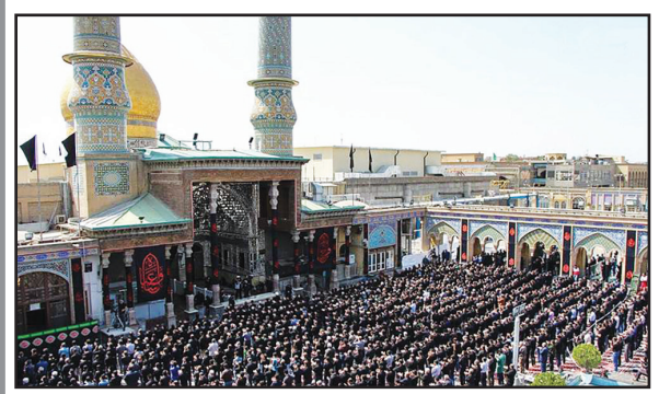
مراسم باشکوه عزاداری سید و در شهر ری با حضور عشاق سالار شهیدان، در حرم حضرت جانشوخته آن امام برگزار عبدالعظیم حسنی (ع) واقع گردید.

حال وهوای حرم حضرت عبدالعظیم در ایام محرم