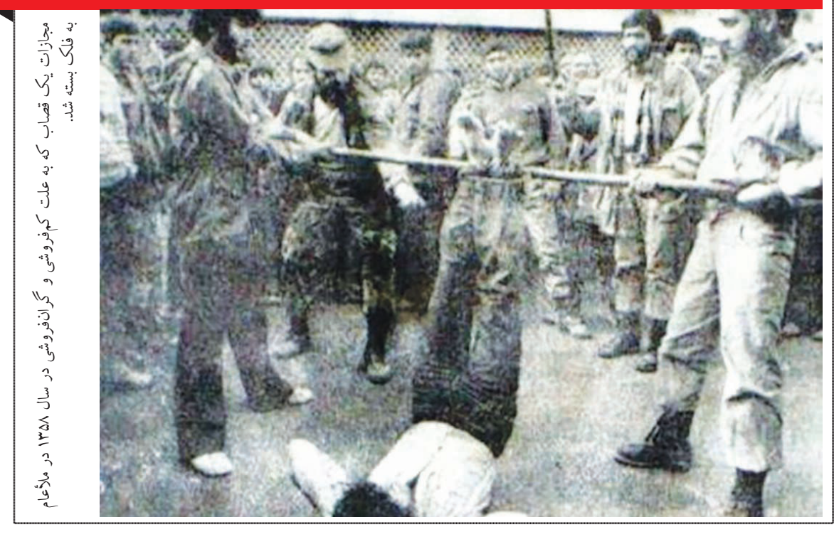
مجازات یک قصاب که به علت کم‌فروشی و گران‌فروشی در سال ۱۳۵۸ در ملأعام به فلک بسته شد.