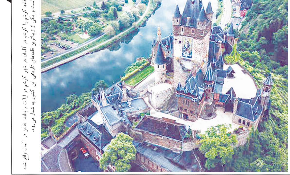
قلعه کوکوم یا کوکوم در شهر کوکوم در ایالت راینلند-فالتز در آلمان واقع شده است و یکی از زیباترین قلعه های تاریخی این کشور به شمار می رود.