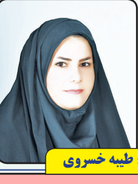
منتظر داستان و اشعار شما هستیم

سوز دلی دارم که می‌گیرد دقارت را شاید به این پاییز بسیاری بهارت را بوی تو در پیراهنم جامانده می‌ترسم یک هرزه باد از من بگیرد یادگارت را آینه، شد صد تکه اما باز هر تکه از یک دریچه رنگ زد نقش و نگارت را مجنون‌تر از ببیند و می‌لرزند بی لیل بر شانه‌ها بگذار چشم اشکبارت را تو تشنه خون، گلویم تشنه زخم است پایان دهیم این بار، من حرف، تو کارت را