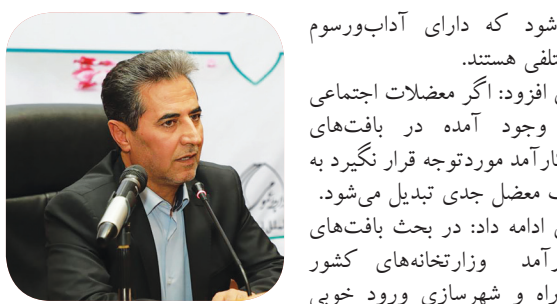
مشاور وزیر کشور

وی افزود: جای تحقیق اصولی در حوزه کشاورزی خالی است و این در حالی است که کار کارشناسی در حوزه کشاورزی نیز بسیار کم است و در این حوزه از کار علمی فاصله گرفتیم. حمیدیان بیان کرد: کارشناسی در این حوزه بسیار کم است و در این حوزه از کار علمی فاصله گرفتیم.