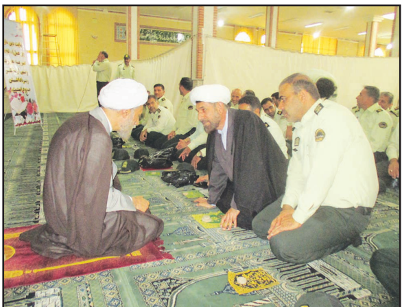
فرماندهی کل قوا در همه عرصه‌ها بر قله است.

توسط کارکنان جان‌برکف فرماندهی انتظامی شهرستان شیراز است و بیش از ۷۱۰۰ مورد کشفیات شرت در شش‌ماه ابتدایی سال ۹۷ داشته‌ام. در ادامه نماینده ولی‌فقیه در فارس و امام‌جمعه شیراز با تبریک فرارسیدن هفته ناجا به ایثارگران جان‌برکف و سلحشوران نیروی انتظامی گفت: باب شهادت همیشه در نیروهای انتظامی، مدافعین نظم، امنیت و آرامش در کشور باز است و بعد از جنگ تحمیلی درحالی‌که ۳۰ سال است در شرایط صلح قرار داریم این عزیزان در مبارزه، سرکوب مخلان نظم، امنیت، اشرار و سوداگران مرگ بیشترین شهدا را تقدیم نظام مقدس، میهن اسلامی، آرمان‌های امام راحل، منویات و رهنمودهای مقام معظم رهبری و فرماندهی کل قوا کرده است. دژکام افزود: در اولین روز از آغاز هفته دفاع مقدس، سلحشوران و جانب‌برکفان نیروی انتظامی فارس اقتدار، صلابت و آمادگی خود را مقتدرانه در معرض نمایش گذاشتند و از آمادگی، وحدت، همدلی ارتش، سپاه، نیروی انتظامی و بسیج مردمی در رژه نیروهای مسلح لذت بردم. امام‌جمعه شیراز بیان داشت: استان فارس با داشتن نیروهای مسلح مقتدر و مردم همیشه درصحنه، پادربکاب و ولایت‌مدار به تعبیر مقام معظم رهبری و