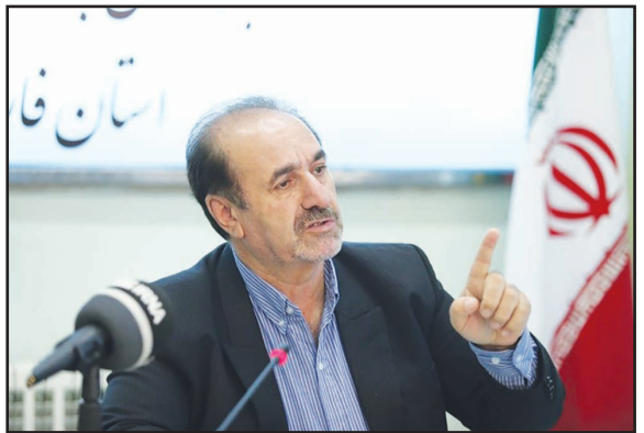
اصولی و درستی بر فعالیت این شرکت‌ها داشت.

بازار، کیفیت و سود خود را مشخص می‌کند. وی ادامه داد: در کشور ما نوعی از اقتصاد به نام تعاونی تعریف شده، مشخص نیست که دست اقتصاد تعاونی به کجا متصل است. رضایی عنوان کرد: اگر این شرکت‌های خودروسازی صرفاً به بخش دولتی و یا خصوصی وابسته بودند بهتر می‌شد با تخلفات و مشکلات پیرامونی این صنعت به لحاظ کیفیت و قیمت رسیدگی کرد. وی عنوان کرد: شرکت خودروسازی سایپا حدود دو هزار میلیارد تومان و ایران‌خودرو نیز دو هزار و ۵۰۰ میلیارد تومان زیان دارند که اگر حمایت‌های دولتی نباشد ورشکسته و تعطیل خواهند شد. نماینده مردم شیراز در مجلس شورای اسلامی بیان کرد: اگر خواهان بهبود وضعیت صنعت خودرو در کشور هستیم باید ساختارهای موجود تغییر کند و مشخص شود که این شرکت‌های خودروساز دولتی هستند و یا خصوصی تا این ساختار در کشور اجرایی نشود نمی‌توان نظارت