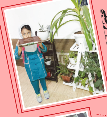
پاییز زینت درخت