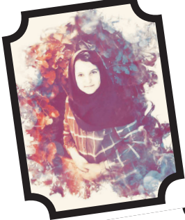
حدیث سجادی منش

روزی پسری با مادرش رفتند دکتر در راه برگشتن پسر گفت: مامان موافقی دو تا بستنی بخریم؟ مادر قبول کرد و به پسر پول داد او هم پول را معکم توی مشتش قایم کرد تا به مغازه رسیدند. پسر دو تا بستنی از یقچاک مغازه برداشت و رفت پیش فروشنده که حساب کند، اما دید توی دستش پولی نیست. نگران دوید پیش مادرش و گفت: مامان! مامان! پول بستنی رو کم کردم. مادر گفت: اشکالی نداره بیا با هم دنبالش بگردیم. هر چه روی زمین را گشتند پول را پیدا نکردند. فروشنده که متوجه آنها شد گفت: پسر! یه سری به یقچاک بستنی‌ها بزن شاید اونجا انداخته باشی. پسر رفت سر یقچاک و دید پولش میاله شده کنار بستنی‌ها افتاده با فوشالی پول را برداشت و به فروشنده داد. مادرش لبند زد و گفت: پسر! پول حلال کم نمیشه. پسر گفت: مامان! پول حلال یعنی چی؟ مادر گفت: یعنی پولی که با زحمت به دست اومده باشه.