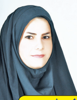
کارشناس این شماره: سرویس ادبی - هنری: طیبه خسروی