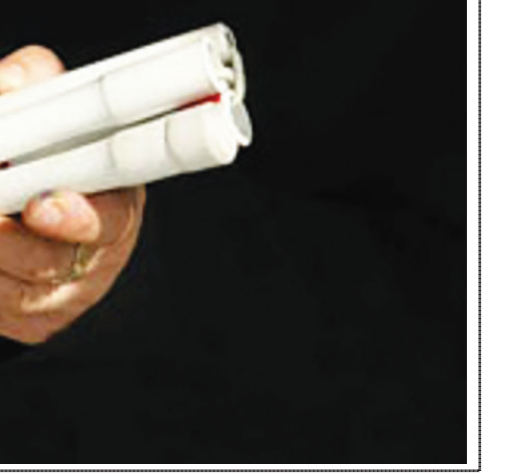
روز جهانی عصای سفید گرامی باد

تیم نونان رئیس کنفدراسیون بین‌المللی اتحادیه‌های کارگری چشم دل باز کن که جان بینی آنچه نلایدنی است آن بینی