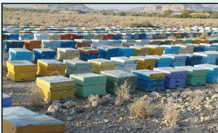
مدیر جهاد کشاورزی شهرستان خنج گفت: کوچ پاییزه

بیش از ۶۰ هزار کلنی زنبورعسل در خنج مستقر شد