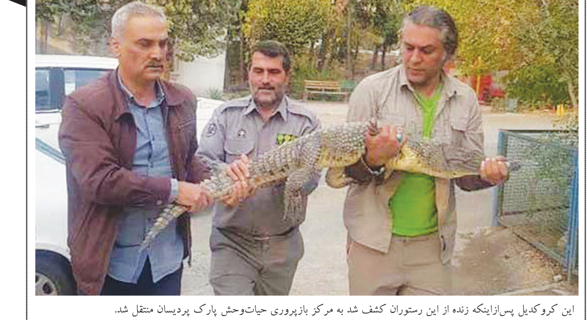
این کروکدیل پس‌ازاینکه زنده از این رستوران کشف شد به مرکز بازرسی حیات‌وحش پارک پردیسان منتقل شد.