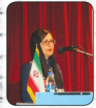
تیرا فنی سلاسه

بادهای وطنم شاعرند می وزند تا عطر گیسوان دختری را با خود ببرند به سکوت اسکله ای خاموش حس شده در سمت چپ سینه پسرک دیده بان بادهای وطنم شاعرند می وزند تا شب بویها خود را به خواب بزنند وقتی پنجره منتظر طلوع تو اذان صبح را در حنجره می گردید... بادهای وطنم شاعرند و شعرهای مرا فقط، دختران سیاه پوش همین طرف مرز می فهمند... بادهای وطنم شاعری را خوب بلدند اگر مرزها بگذارند... بادها شاعری را خوب بلدند حتی، اگر من و تو سکوت کنیم... «از مجموعه بادها شاعرند»