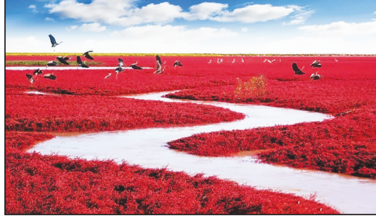
۴. ساحل قرمز در چین اگر از شما بپرسند ساحل یا جنگل چه رنگی است امکان ندارد رنگ قرمز پاسخ اول، دوم یا حتی سوم شما باشد؛ اما ساحل تالایی پانچین کشور چین، هر سال در فصل پاییز به رنگ قرمز چشم‌نواز درمی‌آید. این رنگ قرمز زیبا نتیجه دست‌کاری تصاویر نیست، گیاهی به نام Sueda در این منطقه رشد می‌کند که در دوره خاصی قرمز رنگ می‌شود. در فصل تابستان اینجا به‌طور مطلق سبزرنگ است؛ اما با رسیدن پاییز، قرمز تنها رنگی است که دیده می‌شود.