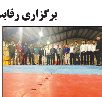
برگزاری رقابت‌های بین سبکی کیک بوکسینگ در شیراز

کامیاب پروژه‌های نیمه‌تمام باقی‌مانده از دولت‌های