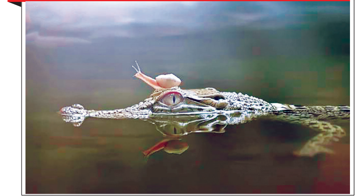
از نگاه دوربین