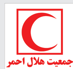
جمعیت هلال احمر