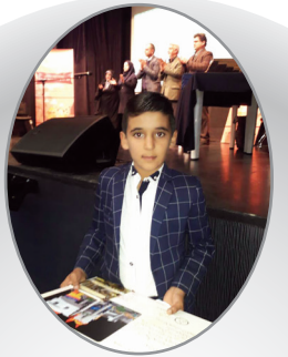
خط‌های سیاه نصفه